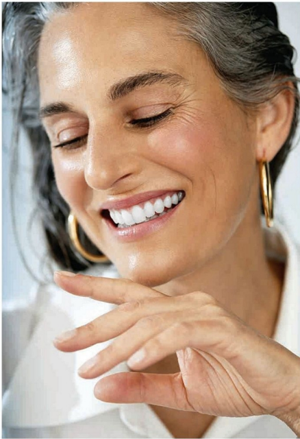
Wickelbluse von & Other Stories, ca. 110 €. Vergoldete Creolen von Romantico Romantico, ca. 255 €