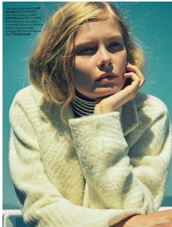
Cappotto in lana mohair, € 679 Marella (tel. 0522927411). Dolcevita in lana e cotone, € 119 (Blaue (tel. 0522927411). Nude look per un viso radioso, reso perfetto da un tocco di crema leggera che idrata, leniga, protegge. BB Cream Perfezione Vuo, € 36,90, Estivel.