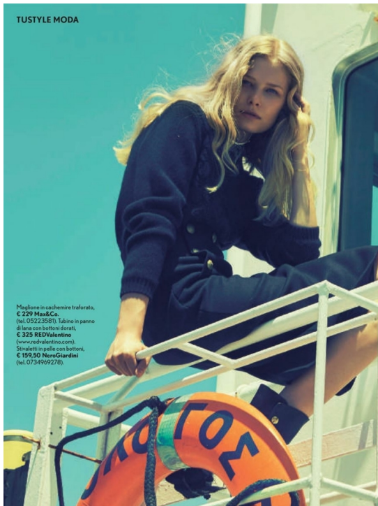
TUSTYLE MODA Maglione in cachemire traforato, € 229 M&Co. (tel. 05223581). Tubino in panno di lana con bottoni dorati, € 325 REDValentino (www.redvalentino.com). Stivali in pelle con bottoni, € 195,50 NeroGiardini (tel. 0734969278).