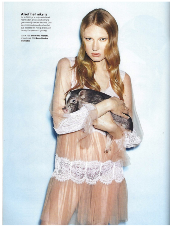
Alsof het niks is Ja, in 2018 ga je in je onderbroek naar buiten. Dit document is niet netjes verder dan ooit. Dus laat maar ondergaan en hou het ook accordeert rustig, af die see through is spannend genoeg. Jurk € 269 Elisabetta Frasca, onderbroek € 20 Love Stories Intimates