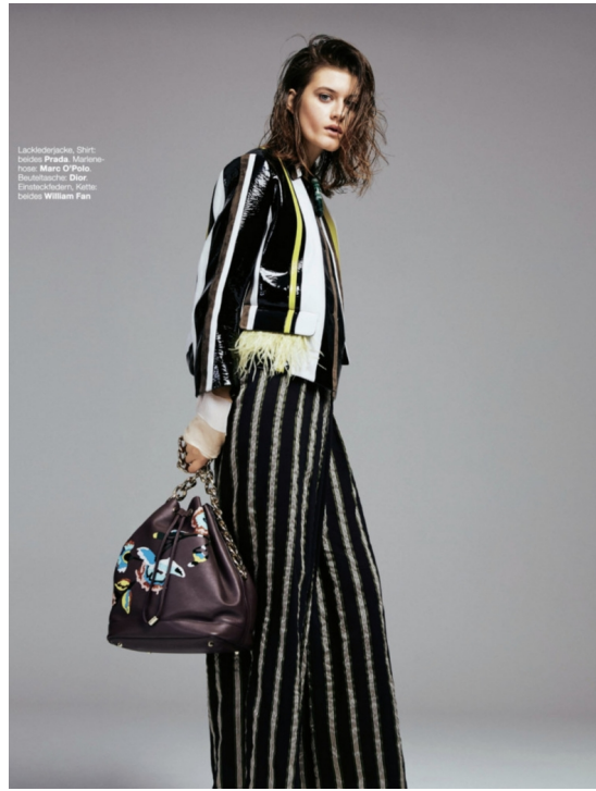
Lacklederjacke, Shirt: Jackie; Prada; Leder- hose: Marc O'Polo; Beuteltasche: Dior; Erschleichen, Kette: beides William Fan