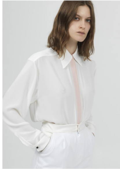
SHIRT S5H1813 - TROUSERS STR1824