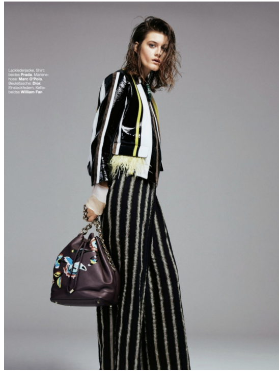
Lacklederjacke, Shirt: Jackie; Prada; Lederhose: Mero O' Polo; Beuteltasche: Dior; Erschlecken, Kette: beides William Fan