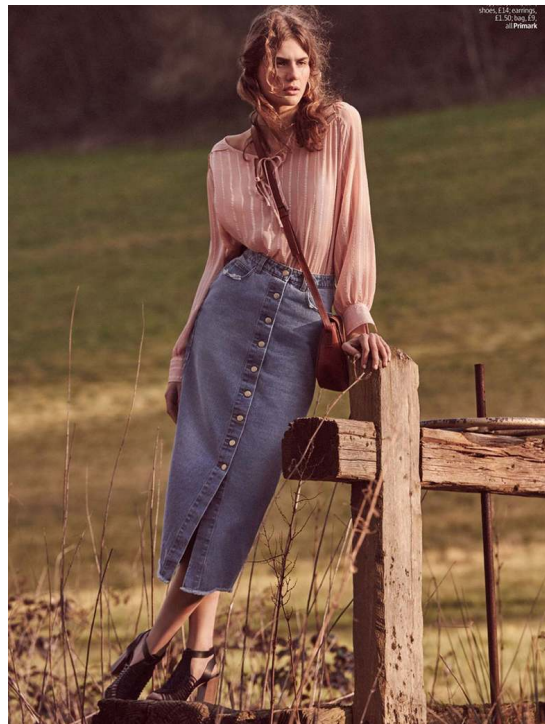
Blouse: £14, evoapp £1.50 per £5 at Primark