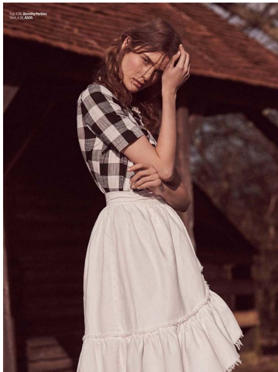
Top: £36, Dorothy Perkins Skirt: £38, ASOS