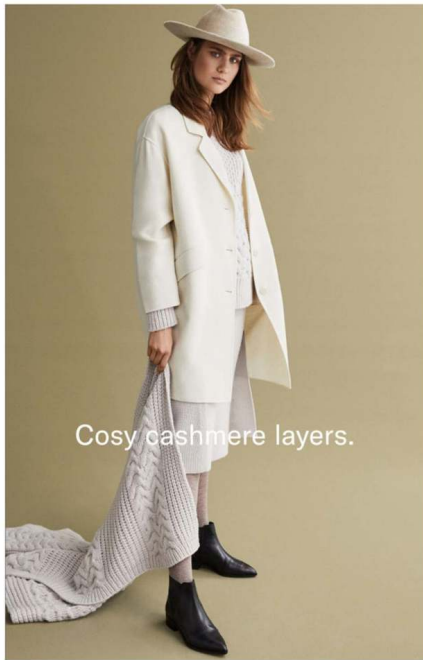
Cosy cashmere layers.