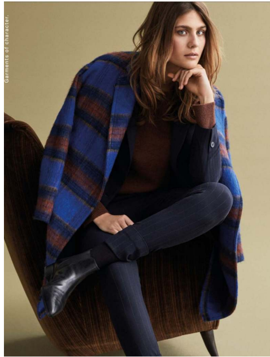
Garments of character.